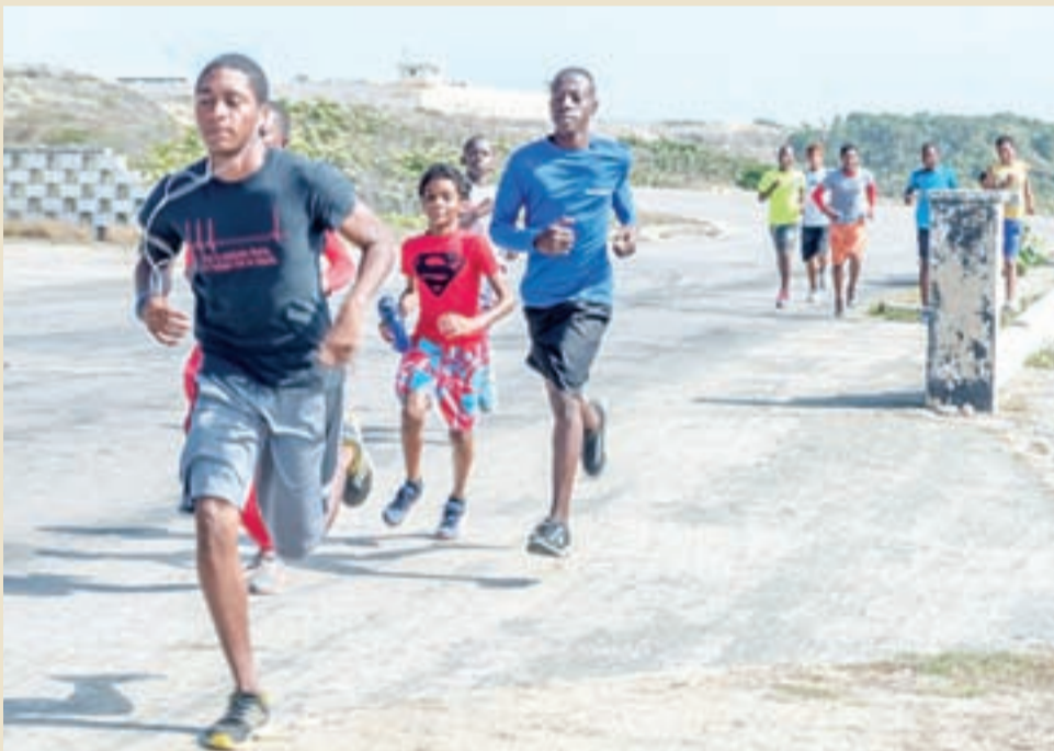
Brazil Taekwondo Stichting su team di Train Hard Fight Smart ta train duro den e dianan aki pa asina wanta e titulo di best team. Les a B4

Un cantidad grandi di persona a inscribi pa bira dunado di sanger